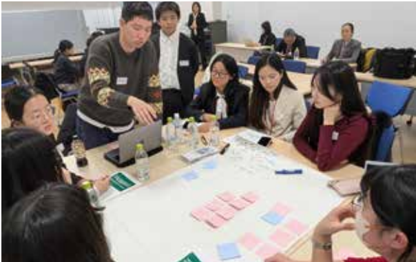
京都大学:中国側の各大学の専攻に合わせたテーマをディスカッション。日本側からは約30名の学生が参加。