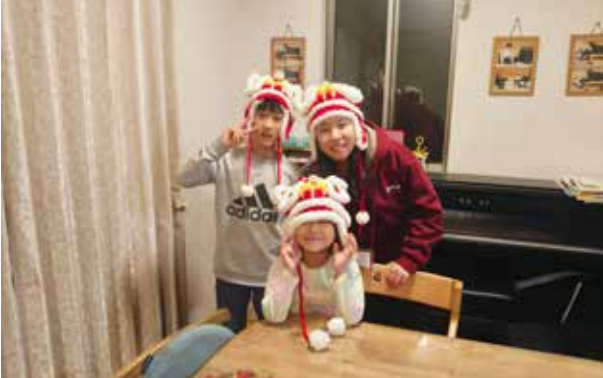
ホームステイ: 幼い子どもたちと遊んだり食事をしたり、日本の家庭の週末の夜を体験。