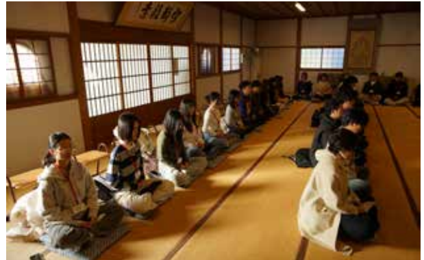
座禅体験:和尚から「呼吸に集中する」といった説明を受けたあと、座禅を組んで鐘の合図と共に瞑想した。