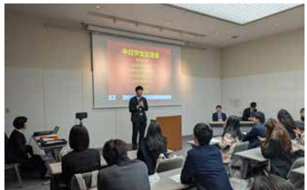
一橋大学:全員が大会議室に戻り、中国側の各大学代表者がこれまでの日本滞在と本日の話し合いの成果を発表。