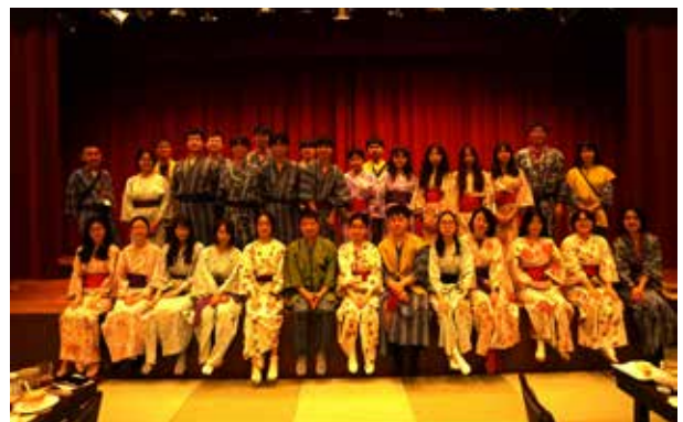
箱根湯本温泉:全員浴衣に着替えて懇親会を開催。大学ごとに出し物を披露し、最後に舞台上で記念に一枚。