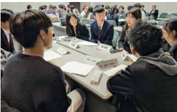
一橋大学:日中合わせて約50名の学生が5グループに分かれ、硬軟取り混ぜた幅広いテーマを話し合った。