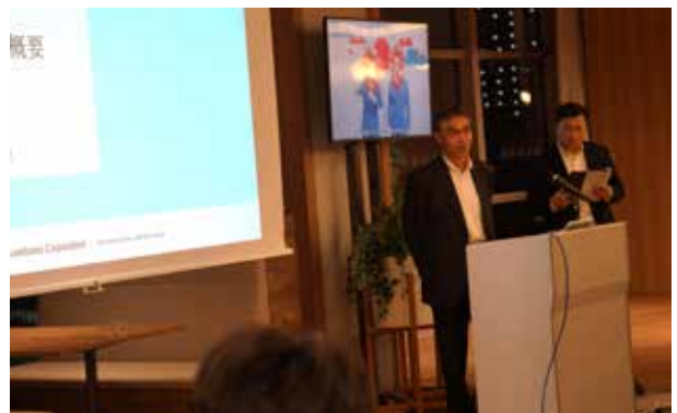
住友商事:学生に向けて同社の17世紀まで遡る歴史や「住友の事業精神」に基づく経営理念や行動指針を説明。