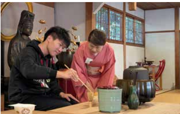
茶道体験:お点前体験ではいち早く挙手した学生三人が茶を点て、団員が味わった。