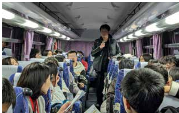
バス: ホテルへ移動するバスの中では、随行員による日本滞在中の注意事項の説明に続いて、学生全員が自己紹介。