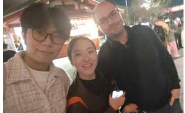
浅草寺: 仲見世通りの賑わいを見物した後にそろって記念撮影。