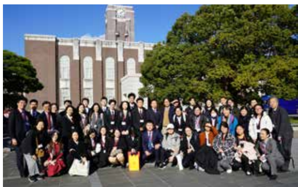
京都大学: 百周年時計台記念館を背景に、出迎いの学生や職員の皆様と一緒に記念撮影。