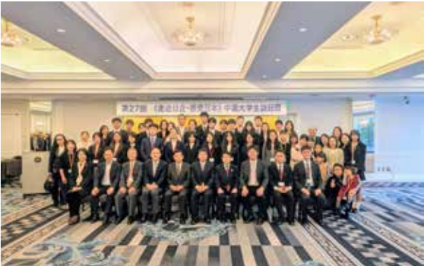
歓送会:ホストファミリーや訪問企業関係者の皆様と最後の記念撮影。