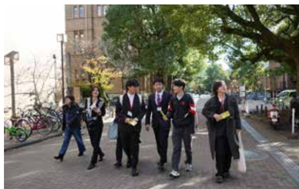
京都大学: グループに分かれて学生の案内でキャンパス内の図書館や吉田寮などを見学。