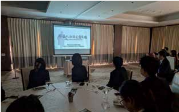
日比谷松本楼:二階の宴会室にて孫文と梅屋庄吉の関係を紹介するビデオを視聴。