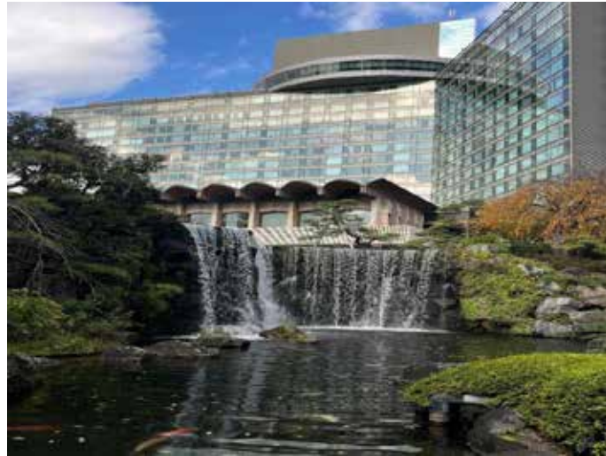
ホテルニューオータニ東京の日本庭園