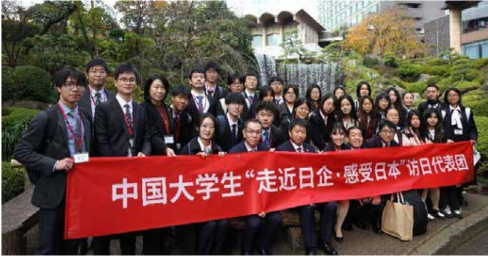
全団員による集合写真