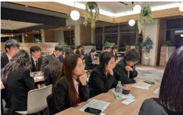
住友商事：在总部大楼26层听取一名在中国工作过的员工介绍工作内容。