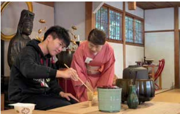
茶道体验：点茶体验环节，最先举手的三名同学上前点茶，其他同学负责品茶。