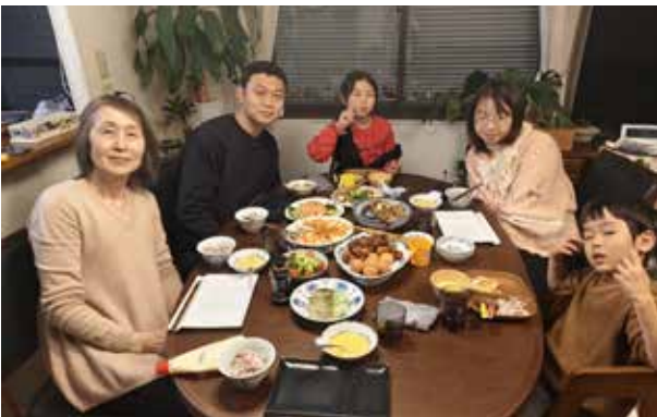
家庭寄宿：周六正好是小朋友的生日，晚上奶奶也过来一同用餐。