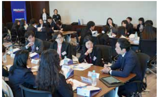
瑞穗银行：在讲座之后，与中国有渊源的员工回答同学们提出的有关在日本工作和生活的提问。