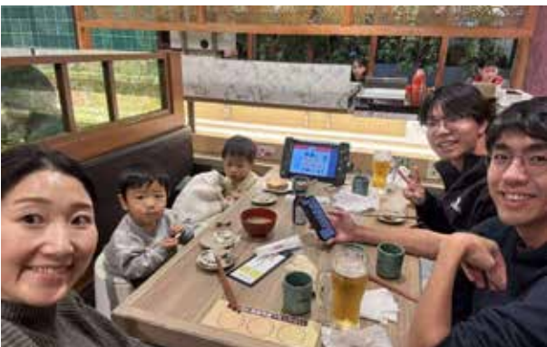
寿司店：一边学习如何蘸酱油，一边大快朵颐地享受鲜切金枪鱼等多种寿司。