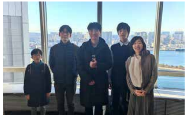
台场：登上富士电视台观景台，眺望东京湾的景色。