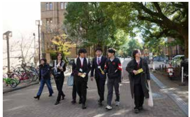
京都大学：在京大学生带领下，分组参观校园内的图书馆和吉田寮等设施。