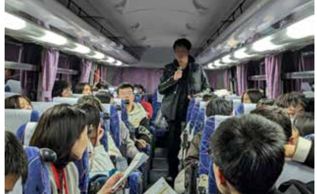
大巴：在开往酒店的大巴上，随行人员讲解本次日本之行的注意事项，随后全体同学进行自我介绍。