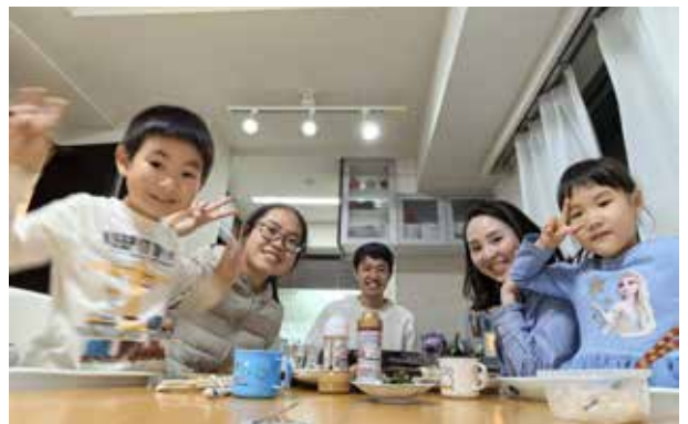
家庭寄宿：寄宿家庭的家常菜加上同学下厨做的一道菜，家庭聚会上线了。