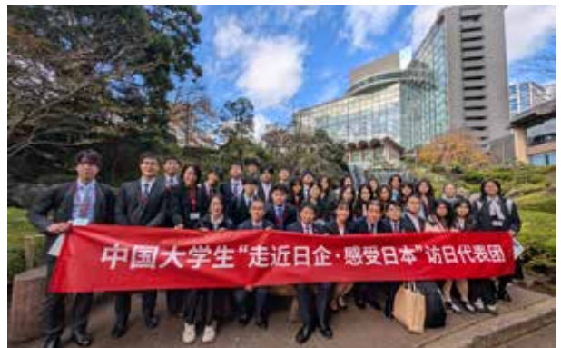
新大谷酒店：参观完生态环保系统，在庭园瀑布前合影留念。