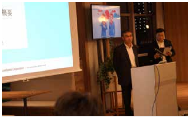
住友商事：公司代表向同学介绍上溯至17世纪的公司历史以及基于“住友事业精神”的经营理念和行为指南。