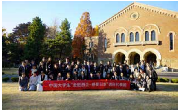
一桥大学：20名左右的学生及大学职员前来迎接代表团，一同在兼松讲堂前合影留念。