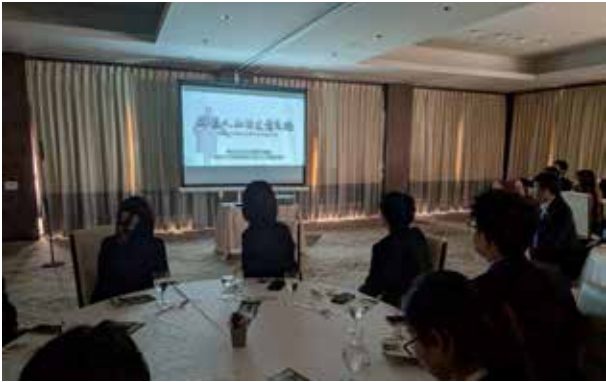
日比谷松本楼：在二层宴会室观看一部录像，介绍的是孙中山与梅屋庄吉的关系。