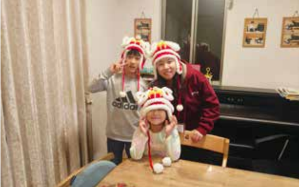
家庭寄宿：和小朋友一起玩，一起吃饭，体验日本家庭周末晚间生活。