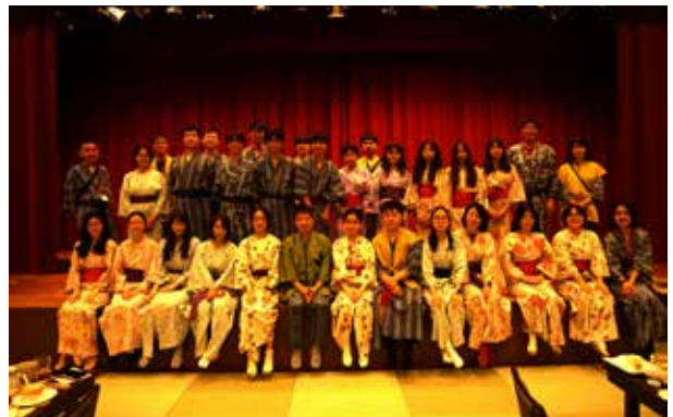
箱根汤本温泉：所有人换上单和服，参加联欢会。各所大学分别表演节目，最后大家一同上台合影留念。