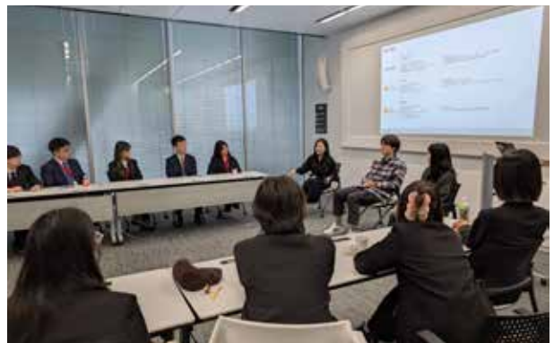
索尼：在索尼互动娱乐公司工作的2名中国籍员工介绍了实际工作内容。