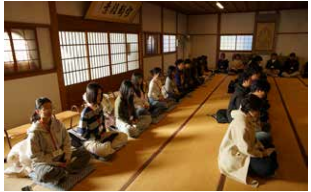
坐禅体验：听了住持“专注于呼吸”的指引后，同学们开始坐禅。伴随着敲钟声，一起进入冥想状态。