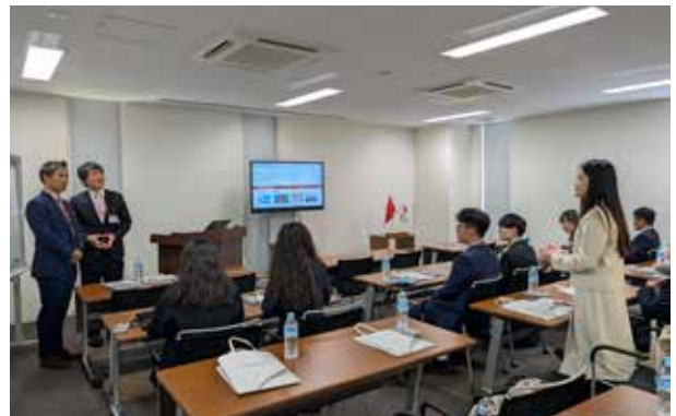
答疑环节中，学生们接连提出与专业相关的问题，木户副室长（左一）详细解答。