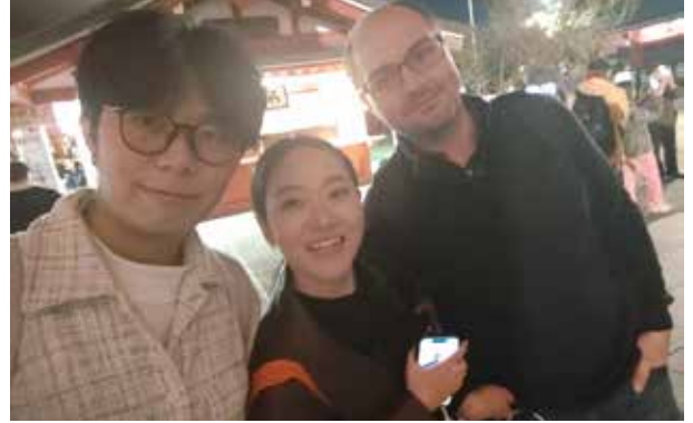
浅草寺：参观完热闹的仲见世大街，合影留念。