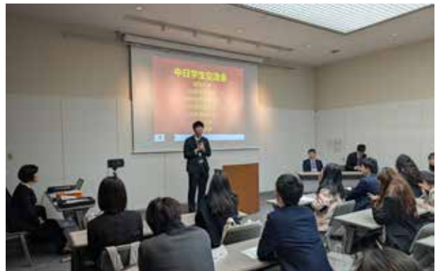
一桥大学：全体成员回到大会议室，由中方各所大学的同学代表发表了这几天在日本的所见所闻以及今天讨论的成果。